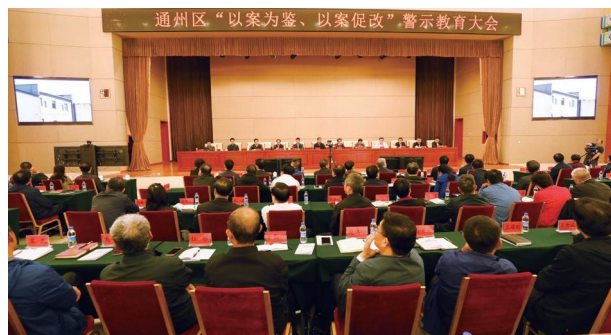
10月12日，通州区“以案为鉴，以案促改”警示教育大会 (区纪委区监委提供) (赵禹桥)

【加强警示教育】 持续做好查办案件“后半篇文章”。注重用好身边已查处的典型案例强化警示震慑。制作《初心的失守》《划地为“牢”》《褪色的“丹心”》等警示教育片。编印《案鉴——党的十八大以来通州区违纪违法典型案例汇编》3000册，发至全区处级以上干部和基层党支部。认真做好处分决定的宣布执行工作，组织重点领域、重要岗位150余名领导干部旁听职务犯罪庭审，首次摘录严重违纪违法领导干部忏悔书，进一步强化“以案为鉴、以案促改”警示教育。着眼政治效果，继续开展对受处分党员的回访关爱，全年回访29人。深化采信了结制度，探索制定惩治诬告陷害、为干部澄清正名的实施办法，为敢于担当的干部担当，有力促进干部履职尽责。