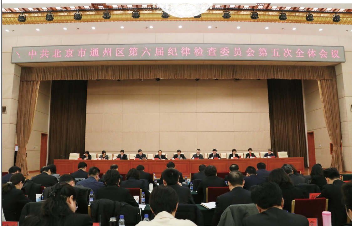
2月15日，中共北京市通州区第六届纪律检查委员会第五次全体会议召开